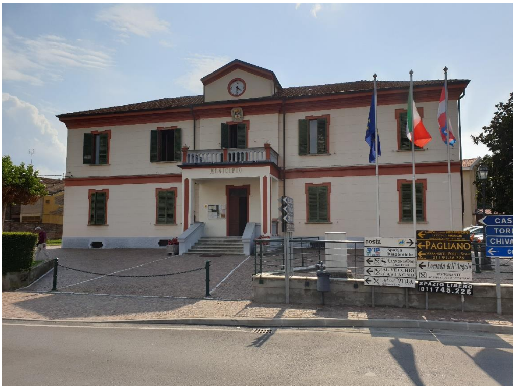
Foto 12 – Facciata est fabbricato (sostituzione gelosie oscuranti)