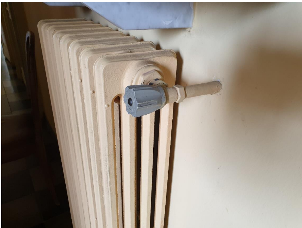
Foto 5 – Radiatore tipo Palazzo Comunale (installazione valvole termostatiche)