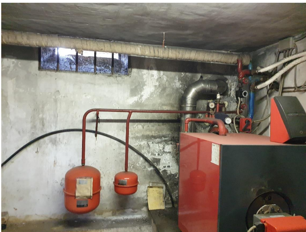
Foto 2 – Caldaia collegata al circuito riscaldamento Palazzo Comunale