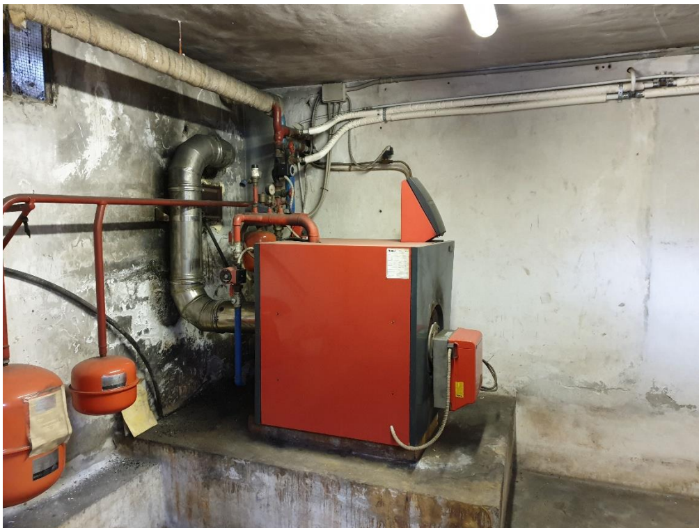
Foto 1 – Caldaia collegata al circuito riscaldamento Palazzo Comunale