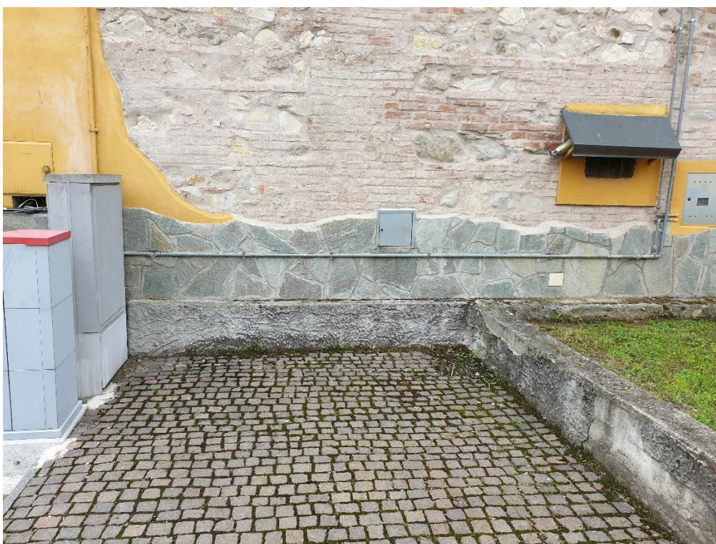
Foto 6 – Zona di realizzazione alloggiamento contatore gas metano