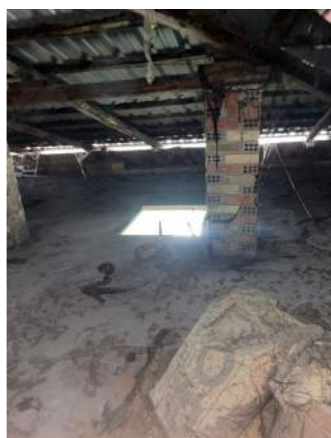
Foto n° 10 - Ripresa fotografica della botola di accesso al sottotetto