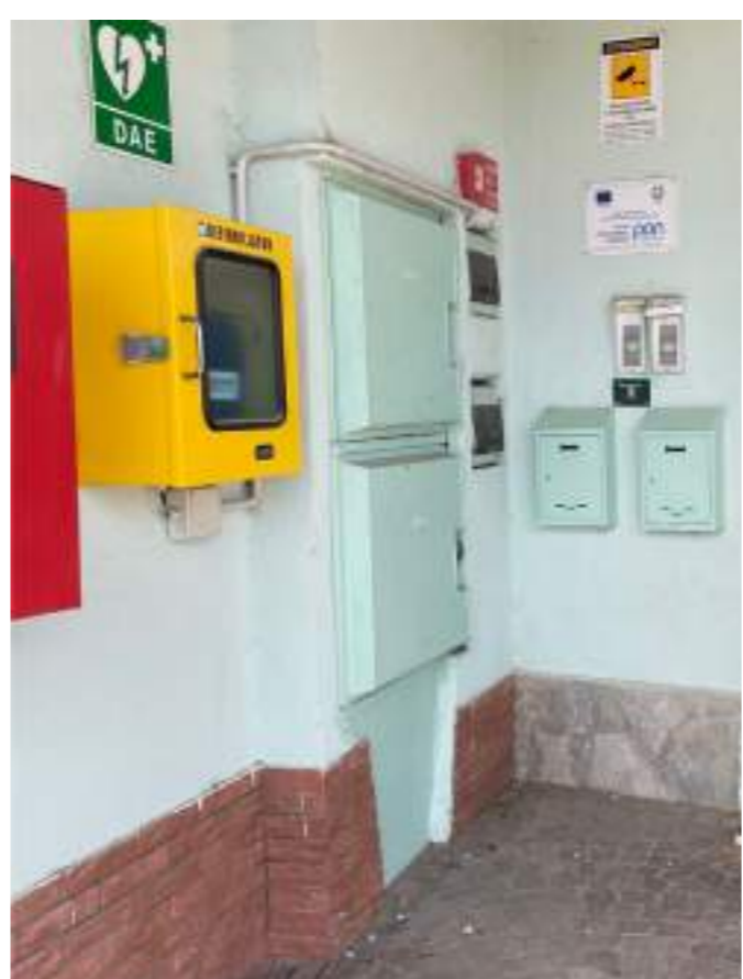
Foto n° 11 - Punto di consegna energia elettrica situato a sinistra della porta d'ingresso dell'edificio scolastico