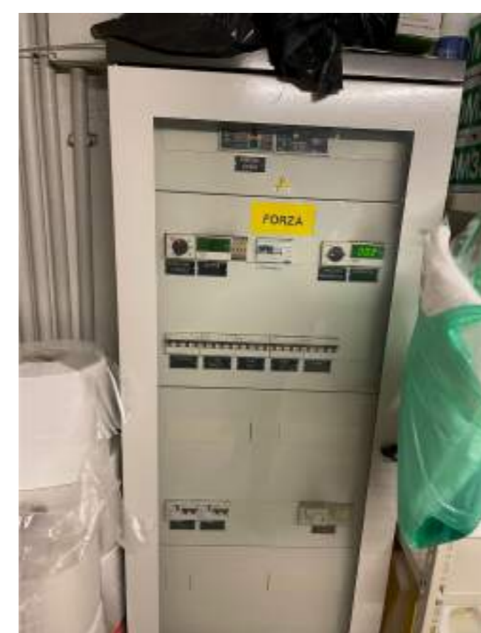
Foto n° 08 - Quadro localizzato nel locale 3 (locale a disposizione scuola) dove verrà installato il sistema di inverter e quadri impianto fotovoltaico