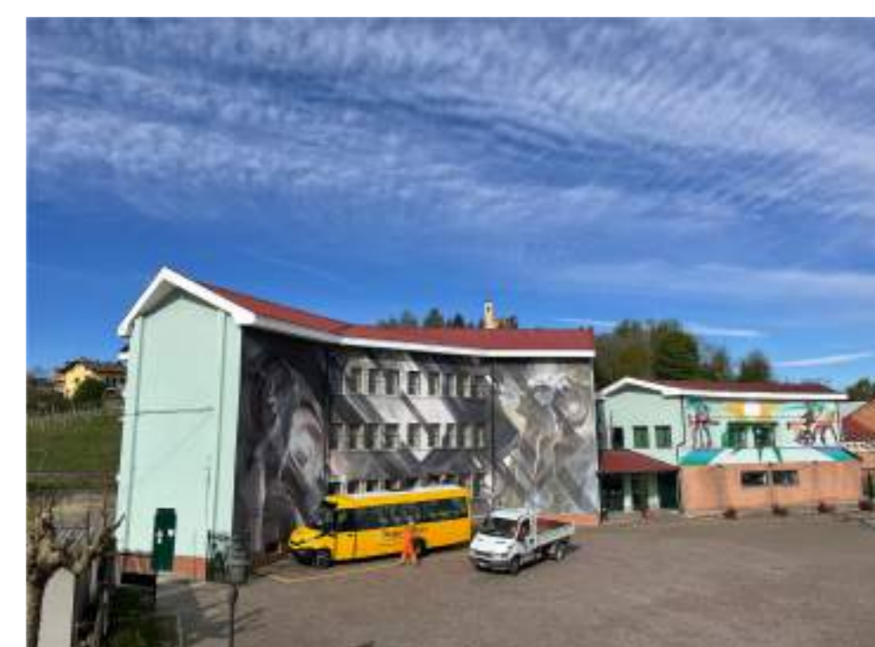
Foto n° 02 - Edificio scolastico (foto scattata da balcone del comune)