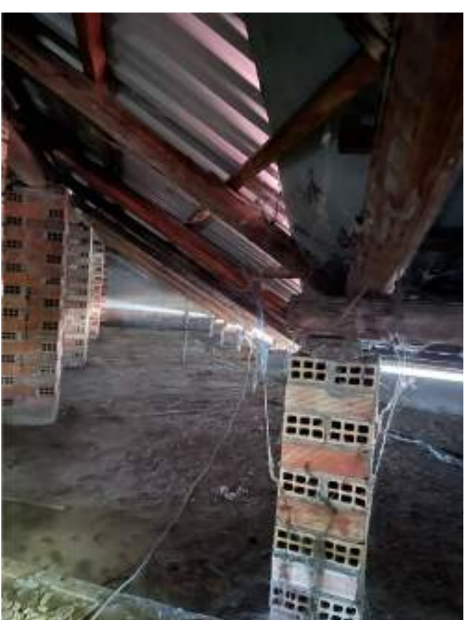
Foto n° 05 - Ripresa fotografica dell'unione delle falde sud e sud-est