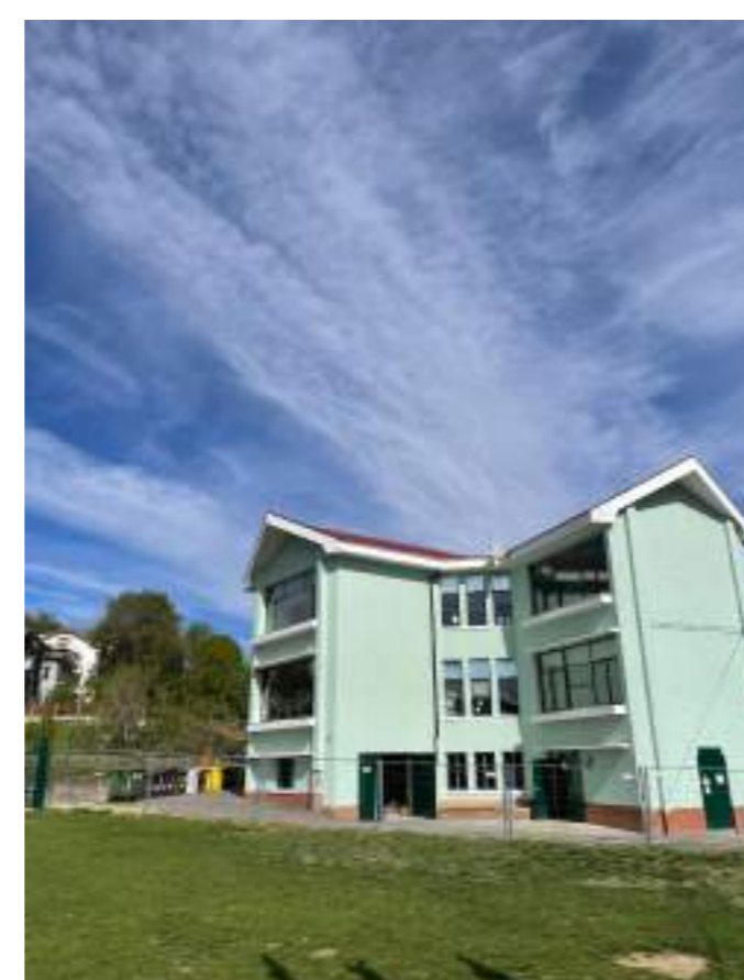
Foto n° 09 - Ripresa fotografica effettuata dai paraggioli adiacente all'edificio scolastico