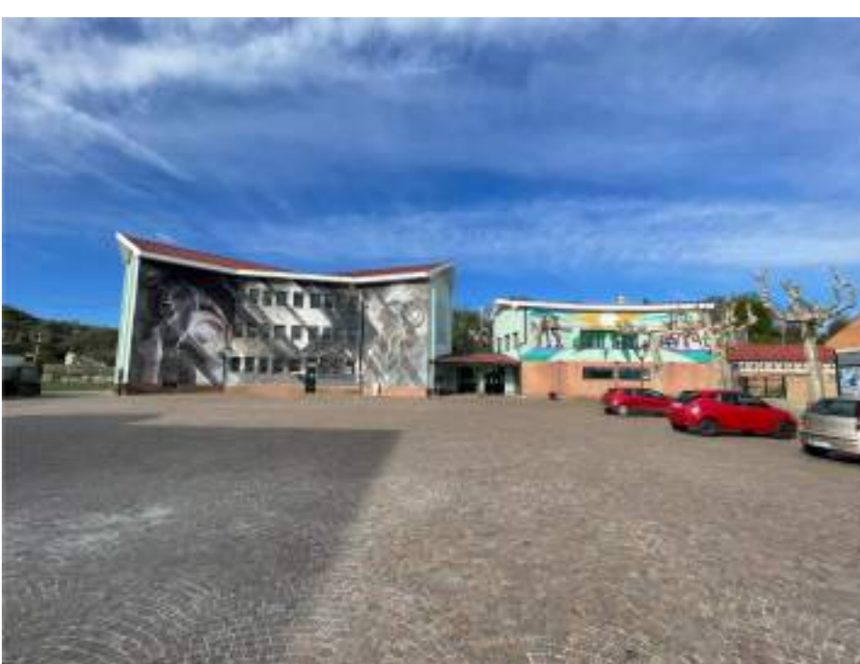
Foto n° 01 - Facciata edificio scolastico vista da Piazza Vittorio Veneto