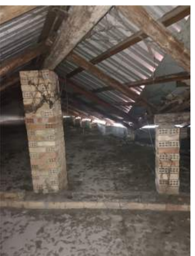
Foto n° 06 - Ripresa fotografica della falda sud effettuata dal sottotetto