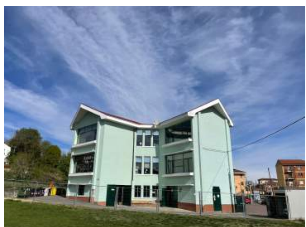
Foto n° 03 - Ripresa fotografica effettuata dai paraggioli adiacente all'edificio scolastico