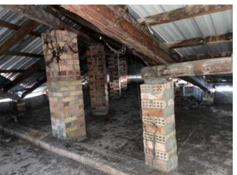
Foto n° 04 - Ripresa fotografica che dimostra lo stato attuale della struttura di copertura